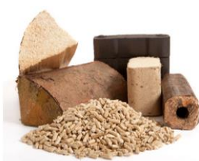
Obr. 10 Palivové drevo, pelety a briekety

Drevárske stroje a technologické zariadenia určujú spôsoby spracovania a opracovania dreva a drevených materiálov a zabezpečujú tak požadované kvalitatívne zmeny týchto materiálov. Do tejto skupiny technologických zariadení patria aj technológie na spracovanie dreveného odpadu.