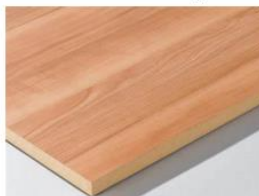
Obr. 4 MDF doska