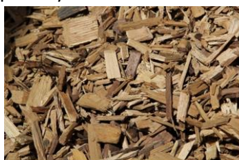
Obr. 9 Drevná štiepka

Drevo je základnou surovinou pri výrobe papiera. Spracovanie dreva na výrobu papiera je komplexný proces, ktorý zahŕňa niekoľko krokov vrátane ťažby dreva, výroby dreveného vlákna, výroba celulózy odstránením lignínu a iných nečistôt, výroby papierového lístia a následného spracovania. Proces výroby papiera z dreva môže byť rôznorodý a môže zahŕňať rôzne techniky a technológie podľa typu papiera a požadovaných vlastností výsledného produktu. Moderné technológie a postupy sa snažia minimalizovať vplyv na životné prostredie a efektívnejšie využívať prírodné zdroje. Drevo ako zdroj obnoviteľnej energie je považované za obnoviteľný zdroj energie a jednu z najlepších náhrad za fosílnu palivá. Palivové drevo môže pochádzať z rôznych druhov stromov a môže byť predávané v rôznych formách. Využitím a spracovaním dreveného odpadu, ako sú hoblíny a piliny v rôznych druhoch drevárskej výroby, vznikla výroba palivových drevených peliet, brieket, blokov. Biomasové drevené palivo je získavané taktiež vo forme drevených polien pochádzajúcich z ťažby dreva najnižších kvalitatívnych stupňov, t.j. dreva nevyužiteľného na ďalšie spracovanie a výrobu drevárskych výrobkov. Pri výbere palivového dreva a jeho produktov je dôležité zohľadniť účel, typ vykurovacej jednotky a dostupnosť. Rôzne formy palivového dreva môžu byť vhodné pre rôzne kúrenie a teplotné potreby.