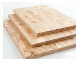
Obr. 5 OSB doska