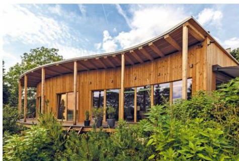
Obr. 7 Drevostavba – pasívny dom

Vďaka svojim výnimočným vlastnostiam drevo spĺňa všetky kritériá pre použitie v drevených stavbách, najmä pevnostné a tepelno-technické. Progresívne technológie lepenia dreva, ktoré umožňujú vyrábať lepené nosníky alebo lepené panely (CLT panely), umožňujú použitie dreva aj na konštrukcie drevostavieb s veľkým rozpätím.