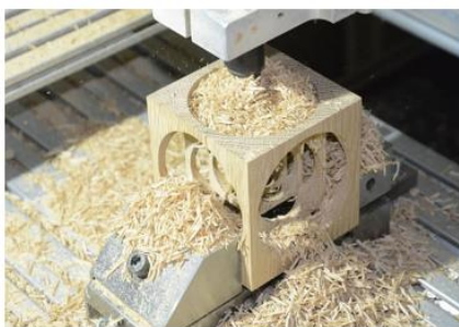
Obr. 12 Výroba CNC frézou