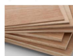
Obr. 6 Plywood doska

Pri výrobe nábytku sa stretávame s rôznym materiálovým prevedením, tradičný materiál stále ostáva drevo a drevené materiály. Pred procesom samotnej výroby nábytku je dôležitý jeho dizajn, tvorba a konštruovanie, ktoré prebiehajú na určitých stupňoch, pričom svoju úlohu zohráva aj to, či ide o bytový nábytok alebo nábytok do verejných, nebytových priestorov. Pri výrobe dreveného nábytku sa používajú rôzne druhy dreva a iných materiálov. Výber materiálu závisí od estetických preferencií, požiadaviek na pevnosť a trvanlivosť, dostupnosti a ceny.