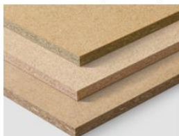
Obr. 3 DTD doska