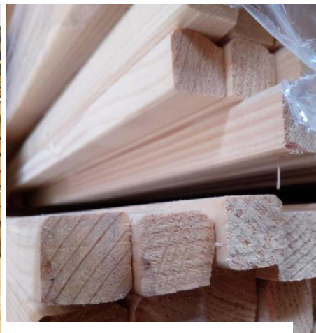
Obr. 2 Opracované hranoly