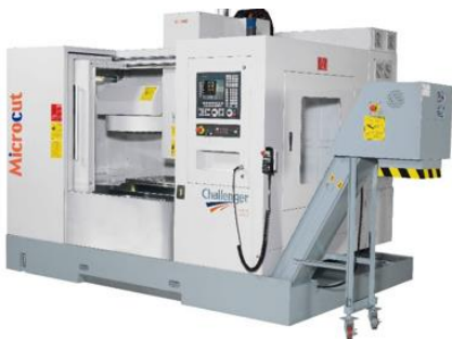
Obr. 11 CNC drevoobrábacie zariadenie

Typickými drevárskymi strojmi sú kotúčové a pásové píly na rezanie dreva, hobľovacie a brúsne stroje, frézky a vrtačky na rezanie drážok a otvorov v dreve, obrábacie stroje na dosiahnutie kruhového alebo valcového tvaru dreva, stroje na lepenie a skladanie dreva, sušiacie komory. Medzi moderné technológie na spracovanie dreva patrí používanie CNC strojov, robotov, počítačového riadenia a iných pokročilých metód, ktoré zvyšujú efektivitu a presnosť výroby.