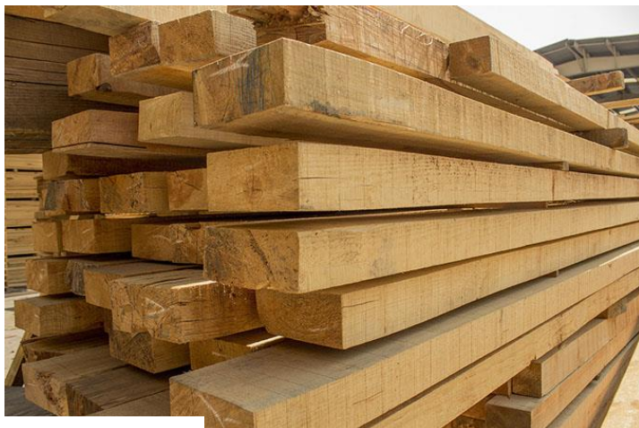
Obr. 1 Rezivo

Prvostupňové spracovanie dreva zahŕňa rôzne metódy transformácie surového dreva na konkrétne výrobky. Patria sem procesy a technológie piliarskej výroby (porez, odkôrňovanie a ohýbanie, hobľovanie a brúsenia dreva), sušenia, hydrotermickej úpravy dreva a procesy lakovania a impregnácie dreva na ochranu dreva pred vlhkosťou, hmyzom, plesniam a hnilobou. Výsledkom prvostupňového spracovania dreva sú produkty ako rezivo, lišty, rohovky, latky, profily, dosky, hranoly, ktoré predstavujú opracované surové drevo rôznych rozmerov, povrchovej úpravy a stupňa vlhkosti.