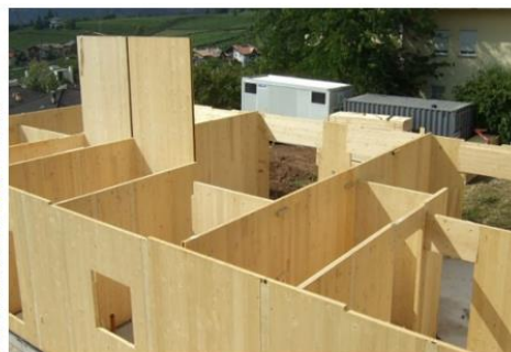
Obr. 8 CLT

Ďalšou oblasťou v drevárstve je chemické spracovanie dreva. Ide o proces, pri ktorom sa používajú chemikálie na zlepšenie vlastností dreva, najmä jeho odolnosti voči hmyzu, plesniam, hnilobe a iným biologickým deštruktívnym vplyvom. Tento proces je bežne využívaný pri výrobe drevených konštrukčných prvkov, plotov, palív a iných drevených výrobkov. Zahŕňa impregnáciu dreva chemikáliami na zvýšenie jeho životnosti. Je dôležité poznamenať, že chemické spracovanie dreva môže mať environmentálne a zdravotné dôsledky. Preto sa pri výbere chemických látok a procesov odporúča dodržiavať bezpečnostné normy a environmentálne smernice.